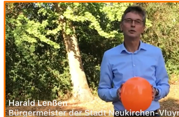
Harald Lenßen Bürgermeister der Stadt Neukirchen-Vluyn