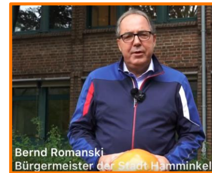
Bernd Romanski Bürgermeister der Stadt Hamminkeln