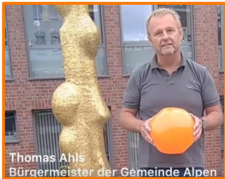
Thomas Ahls Bürgermeister der Gemeinde Alpen