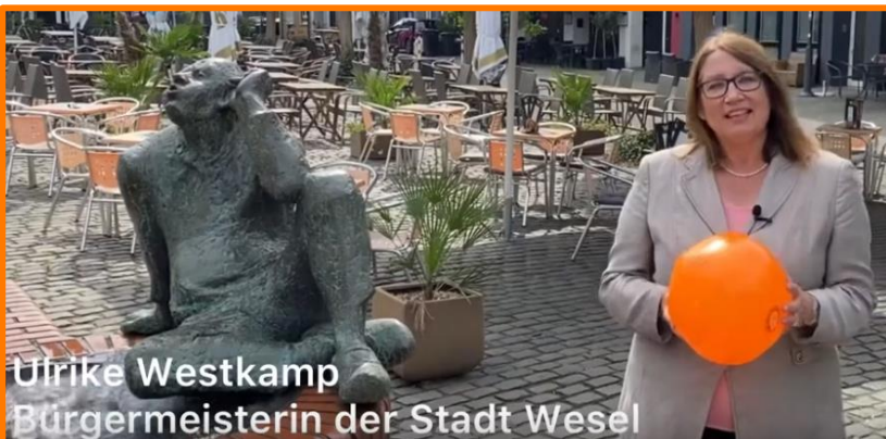
Ulrike Westkamp Bürgermeisterin der Stadt Wesel