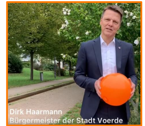
Dirk Haarmann Bürgermeister der Stadt Voerde