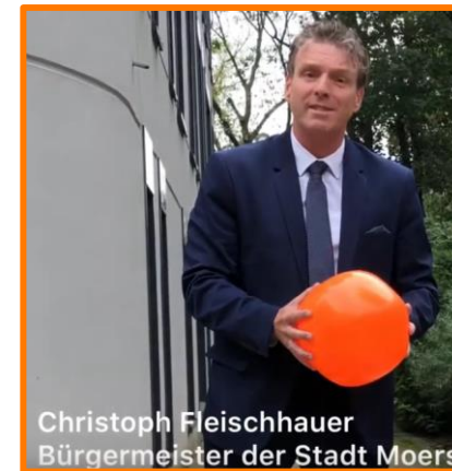
Christoph Fleischhauer Bürgermeister der Stadt Moers