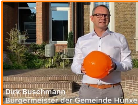
Dirk Buschmann Bürgermeister der Gemeinde Hünxe