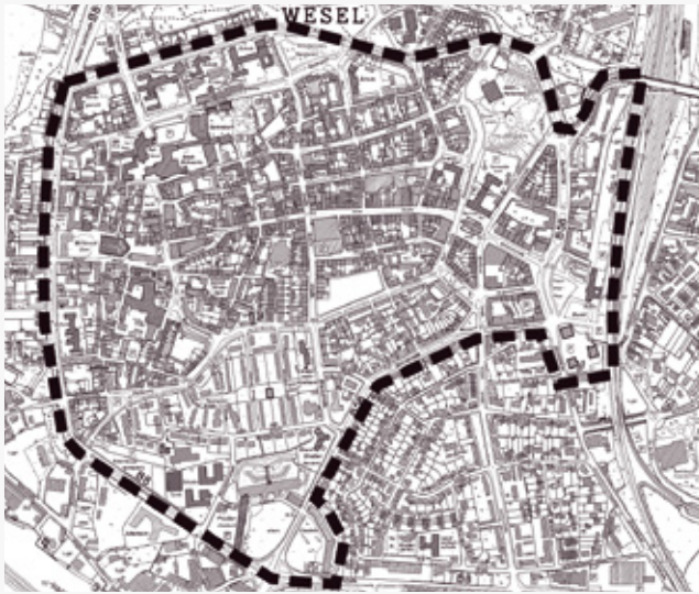
Abgrenzung Stadtumbaugebiet gem. § 171 b BauGB

Im Stadtumbaugebiet „Innenstadt Wesel“ (siehe oben) sind in den letzten Jahren bereits eine Vielzahl von Maßnahmen zur Stadterneuerung umgesetzt worden.